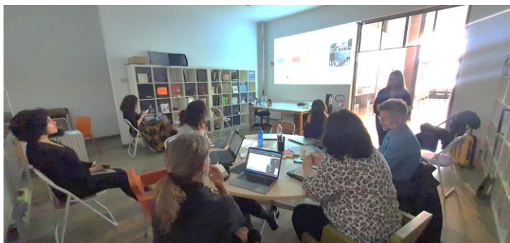
Il consorzio Destex nel corso della presentazione condotta da uno dei partner