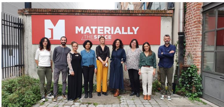
I partner del progetto Destex durante il meeting finale presso la sede di Materially

Lo scorso gennaio, i partner del progetto Destex si sono incontrati, in modalità ibrida, in occasione del 5° meeting transnazionale di progetto. I partner si sono confrontati in particolar modo sull'IO2, il Manuale delle lezioni e l' IO4, il manuale delle buone prassi. In aggiunta, sono stati definiti aspetti logistici relativi al meeting finale.