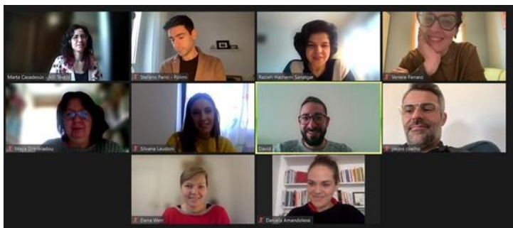
Destex partner nel corso del 5° MTP