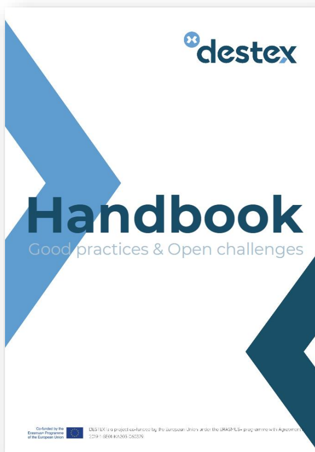
DESTEX Handbook cover

Tra le numerose risorse, mette a disposizione interviste rilasciate dalle imprese che hanno partecipato agli Hackathons , feedback sulle esperienze vissute dagli studenti, sfide aperte e lezioni apprese dal corso estivo tenuto lo scorso anno a cui hanno partecipato gli studenti delle varie università del partenariato nonché da tutti i prodotti sviluppati dai partner.