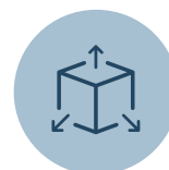
Diseño de producto