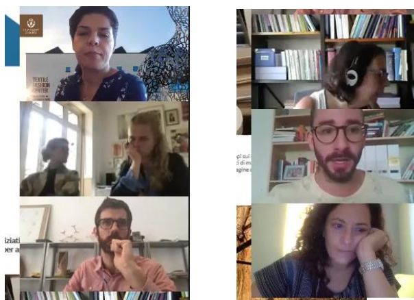
DESTEX partners during the 3 rd project meeting

El partenariat va revisar el progrés del projecte i les activitats pel proper semestre.